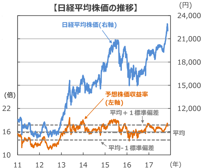
【日経平均株価の推移】

(注1) データは2011年1月4日～2017年11月15日。 (注2) 予想株価収益率は株価÷1株当たり予想利益。1株当たり予想利益（12カ月先行）はBloomberg L.P.予想。予想株価収益率の平均値の計算期間は2011年1月4日～2017年10月31日。