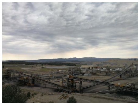
写真1 Maules Creek炭鉱

ニューサウスウェールズ州にあるMaules Creek炭鉱を訪れました（写真1）。オーストラリアの石炭開発の歴史は古く、シドニーを州都とするニューサウスウェールズ州の初期の発展に大きく寄与しました。今回訪れたMaules Creek炭鉱はオーストラリアの鉱山会社ホワイトヘブンコール、伊藤忠商事、電源開発（Jパワー）の3社による合併事業で日本の火力発電所など向けに石炭を輸出しています。同炭鉱は大型資材の導入が可能で露天掘りによる掘削を行っており、高いコスト競争力を持ちます。また港までの輸送に必要な鉄道設備がすでに整備されており（写真2）、輸送費を含めたトータルでのコスト競争力にも優れています。