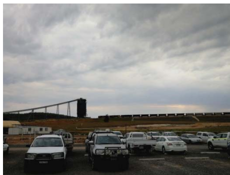
写真2 港までの輸送は鉄道で行われる。