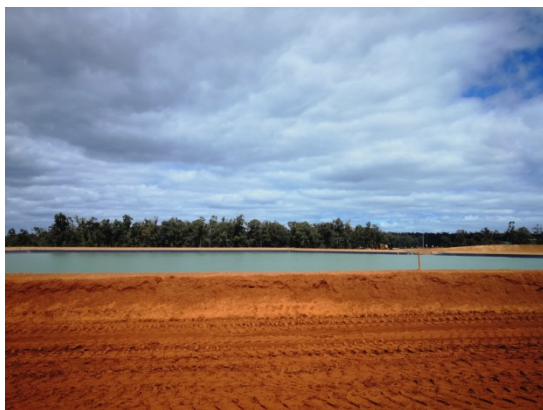
写真5 復元された森や水源