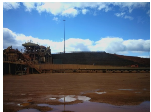
写真4 鉱石の粉碎から精錬所への輸送まで自動化