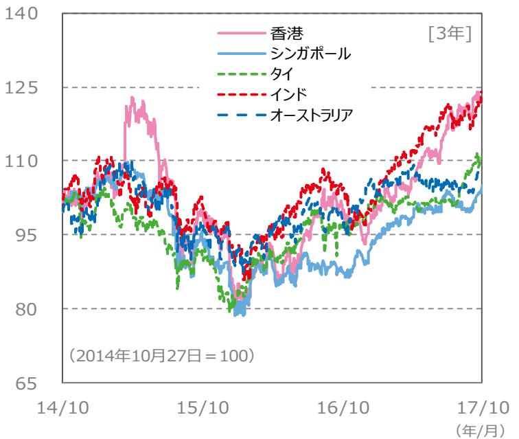
【国・地域別の株価指数の推移】