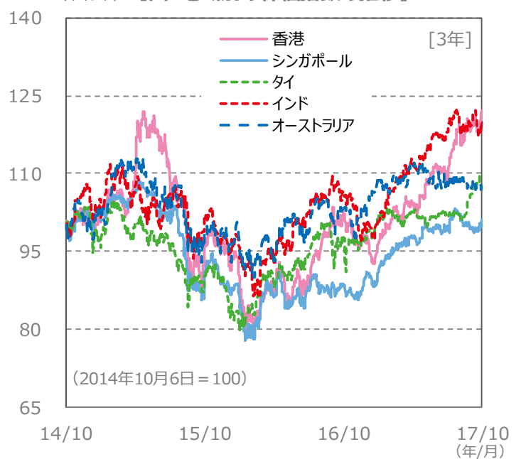
(ポイント) 【国・地域別の株価指数の推移】 [3年]