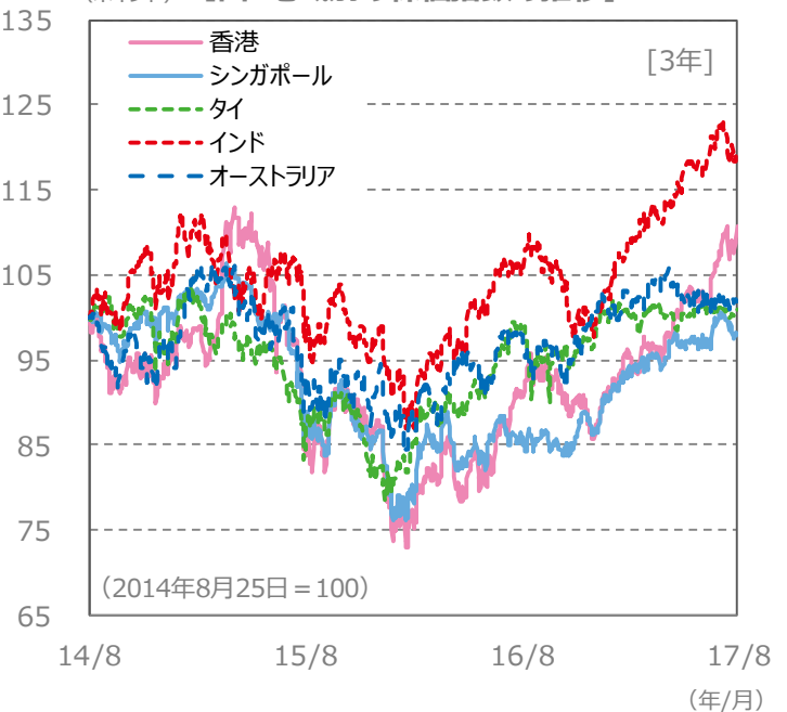
【国・地域別の株価指数の推移】 [3年]