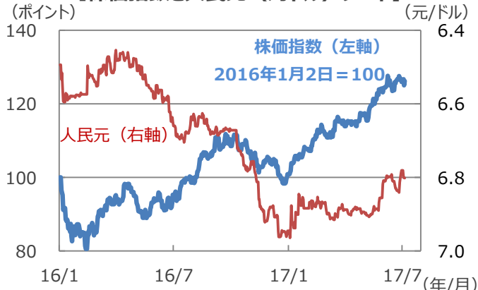
【株価指数と人民元（対ドル）レート】