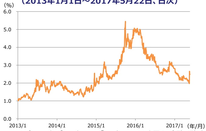
【図表】5年物CDS*の推移 (2013年1月1日～2017年5月22日、日次)

* CDS（クレジット・デフォルト・スワップ）：信用リスクを売買する金融取引。信用リスクの指標となる。