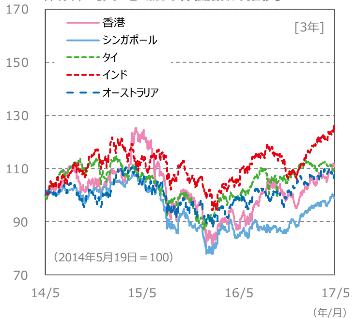
(ポイント) 【国・地域別の株価指数の推移】 [3年]