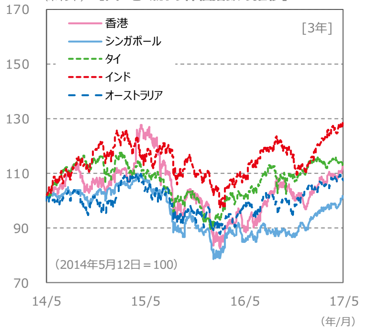
(ポイント) 【国・地域別の株価指数の推移】 [3年]