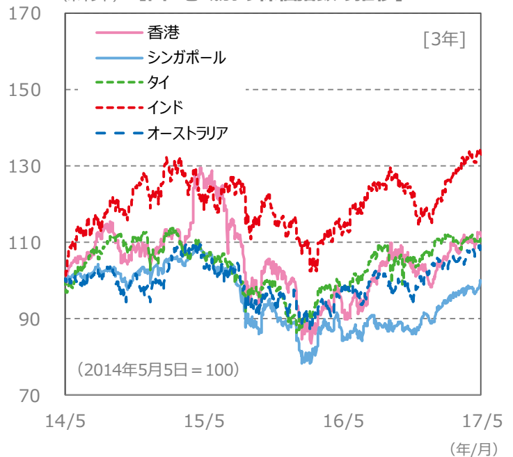
(ポイント) 【国・地域別の株価指数の推移】 [3年]