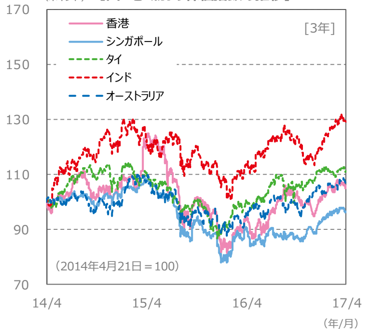
(ポイント) 【国・地域別の株価指数の推移】 [3年]