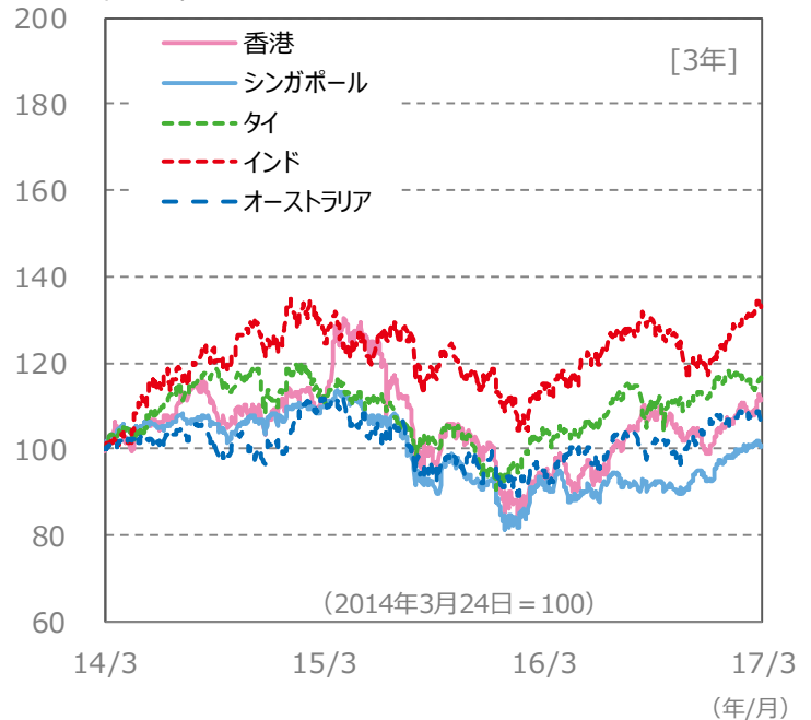
【国・地域別の株価指数の推移】