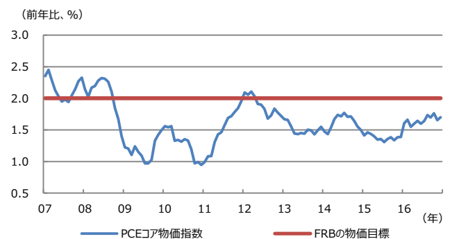
【図表2：米個人消費支出（PCE）物価指数】

(注) データは2007年1月から2016年12月。米連邦準備制度理事会（FRB）は「長期的な物価目標（longer-run goal）」として、PCE物価指数の前年比上昇率を「2%」と定義している。PCEコア物価指数は、PCE物価指数から食品とエネルギーを除いたもの。