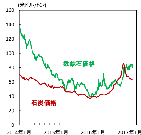
石炭価格と鉄鉱石価格