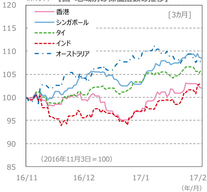
(ポイント) 【国・地域別の株価指数の推移】 [3カ月]