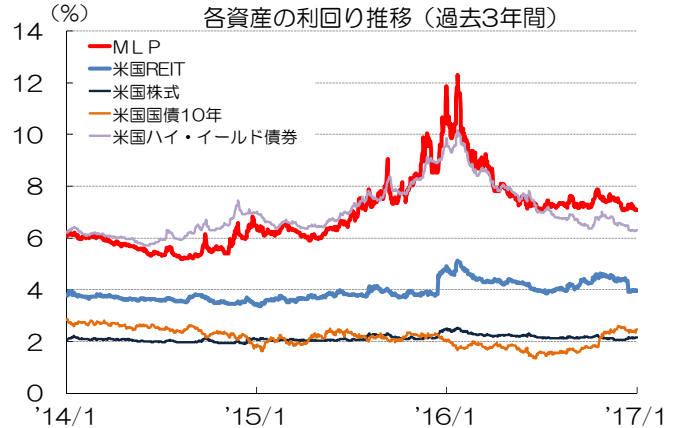
MLPセクター別騰落率